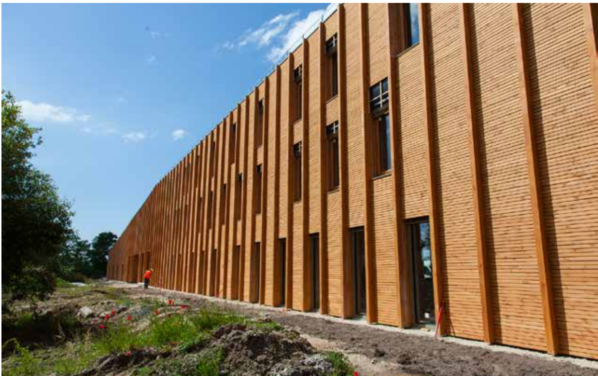
Extension de la Pépinière & Hôtel d'Entreprises de Haute-Gironde, à Saint-Aubin-de-Blaye (33)

Le 13 juin dernier, le CODEFA a organisé ses Rencontres Itinéraire bois sur le chantier de l'extension de la Pépinière & Hôtel d'Entreprises de la Haute-Gironde, à Saint-Aubin-de-Blaye. Projet vitrine, le bâtiment témoigne de l'engagement et de la dynamique de la Communauté de Communes de l'Estuaire à développer ses ressources et son économie locales.